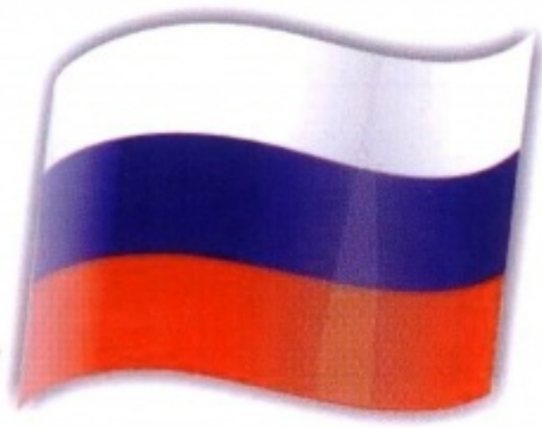
Государственный флаг Российской Федерации