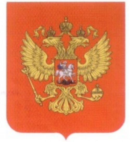
Государственный герб Российской Федерации